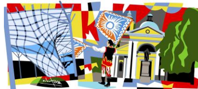
Rho Fiera Milano Expo 2015

Nel centro di Magenta , si può rivivere la storica battaglia attraverso le testimonianze conservate nel Museo della battaglia di Magenta , ospitato nella seicentesca villa Casa Giacobbe.