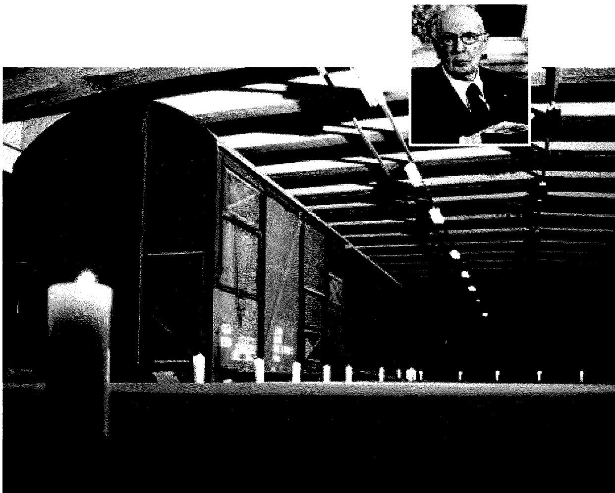
Un momento della cerimonia al Binario 21 della Stazione centrale di Milano. In alto Giorgio Napolitano